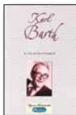
Figure de la lutte contre le nazisme, Karl Barth s'est auparavant distingué par son activité de prédicateur et son engagement social dans sa